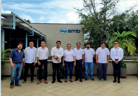
Visita de Aguas Kpital S.A. E.S.P a Acueducto Metropolitano de Bucaramanga S.A. E.S.P.