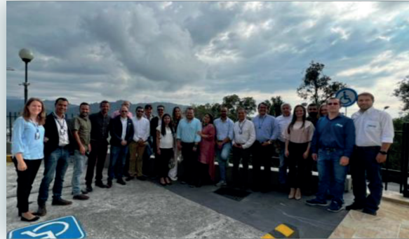
Visita de la Empresa de Acueducto y Alcantarillado de Bogotá E.A.A. E.S.P a Aguas de Manizales S.A. E.S.P.