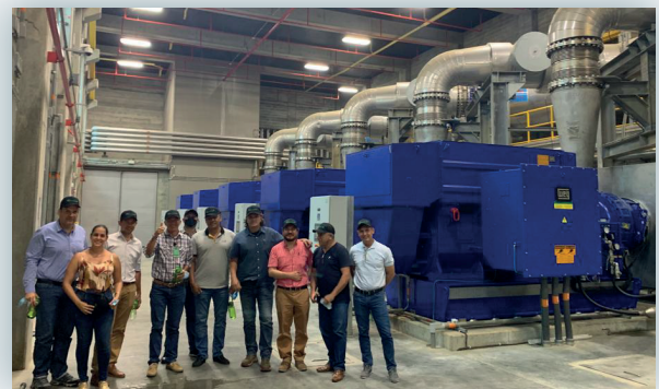
Visita Aguas de Buga S.A. E.S.P a E.P.M