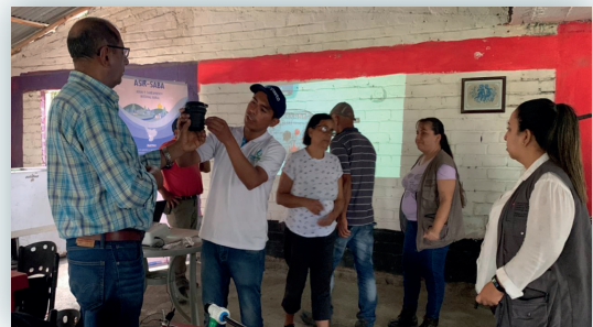
Visita No. 2