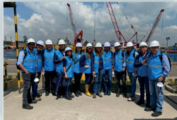
Visita de Aguas de Manizales S.A. E.S.P. a la Empresa de Acueducto y Alcantarillado de Bogotá E.A.A. E.S.P