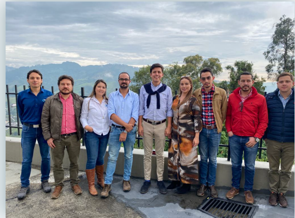
Visita de EmpoDuitama S.A. E.S.P. a Aguas de Manizales S.A. E.S.P.