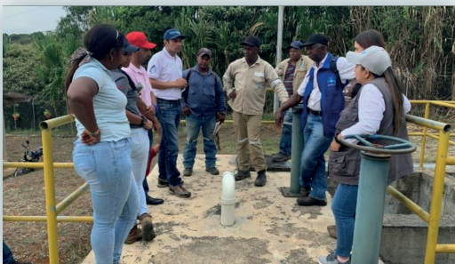
Visita No. 1

Este Hermanamiento cuyo propósito es la transferencia de conocimiento mediante jornadas prácticas y teóricas en la operación y mantenimiento de la infraestructura asociada al abastecimiento y prestación del servicio de agua potable en las comunidades rurales de las veredas Curpaq, San Quepal y del corregimiento de Robledo al finalizar el periodo 2022 ha desarrollado 2 jornadas presenciales por parte de los funcionarios de Empopasto S.A. E.S.P. en cada uno de los territorios, dentro del cual se han considerado aspectos adicionales como el tema comercial y de sostenibilidad financiera.