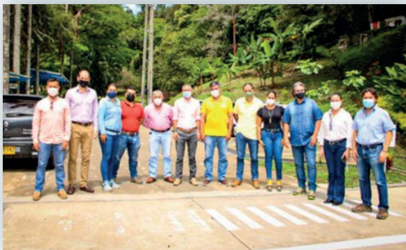
Visita de E.P.M. a Aguas de Buga S.A. E.S.P