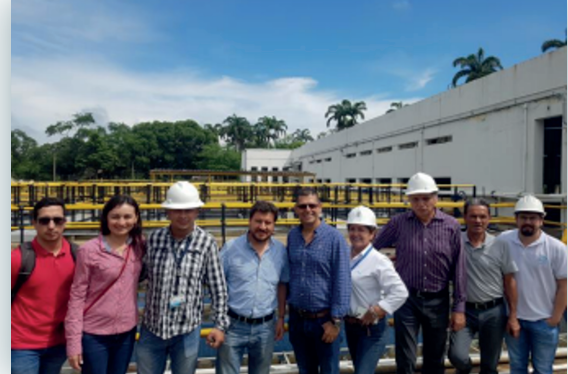
Visita de Acueducto Metropolitano de Bucaramanga S.A. E.S.P a Aguas Kpital S.A. E.S.P