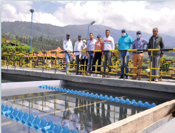
Visita Aguas de Manizales S.A. E.S.P. a EmpoDuitama S.A. E.S.P.